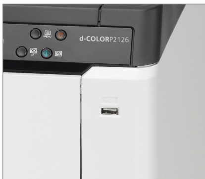
USB-port för utskrift från minne