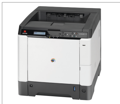
Kompakt och enkel att använda