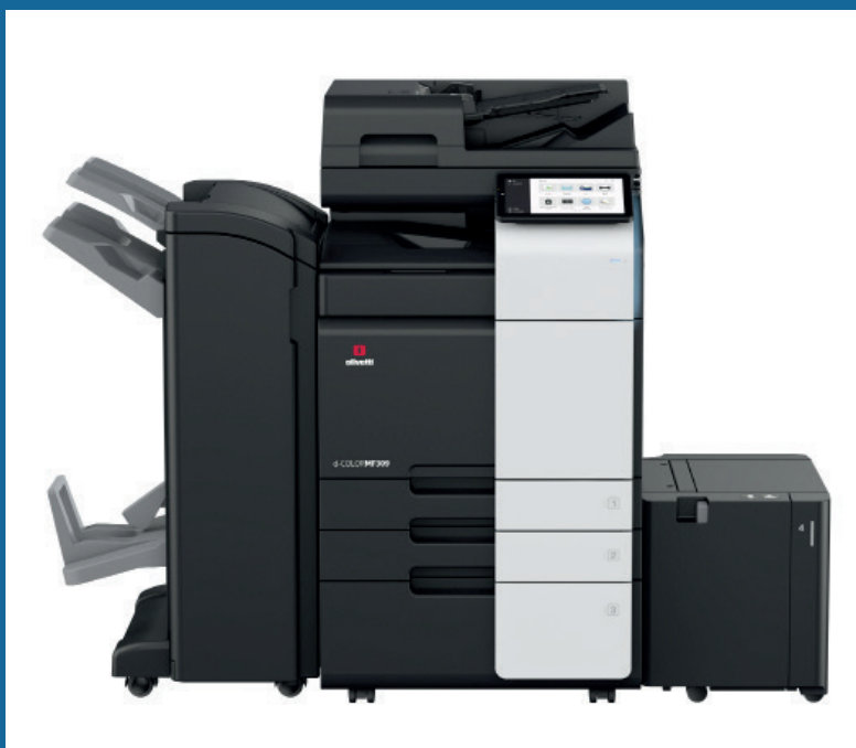
d-Color MF309 utrustad med DF-714+PC-416+LU-302+RU-513+FS-536SD

Ny 10,1" multi-touch pekskärm, som kan vibrera för att ge större beröringskänslighet