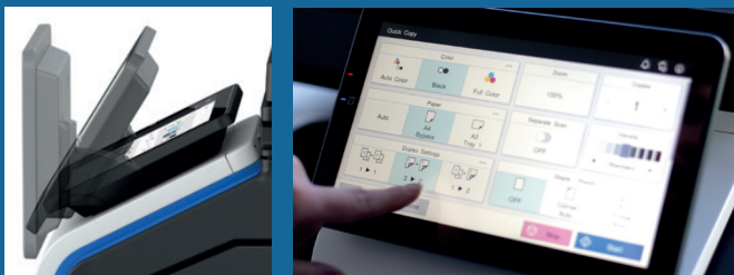
10.1" färgpekskärm, justerbar