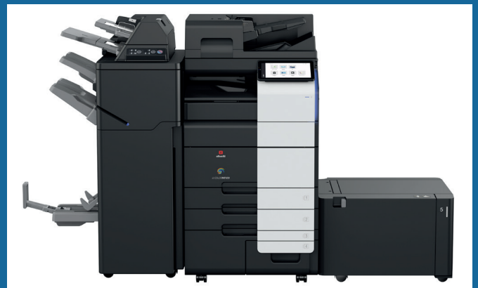
Konfigurerad med efterbehandlare FS-540SD, post-inserter PI-507, RU-513 och sidokassett LU-207