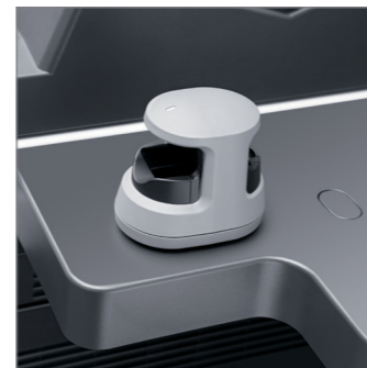
Avancerade säkerhetsalternativ, flera autentiseringssystem (tillval)