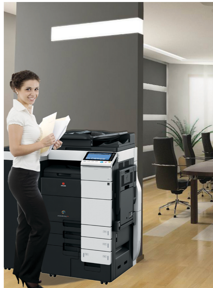
Den ergonomiska designen och låga strömförbrukningen gör att den här enheten är perfekt för alla kontor eller arbetsgrupper

Dessutom kan mobila enheter som smarttelefoner och datorplattor (iOS och Android) skriva ut direkt till de här modellerna via en utskriftsapp för mobilen (Wi-Fi-tillgång krävs).