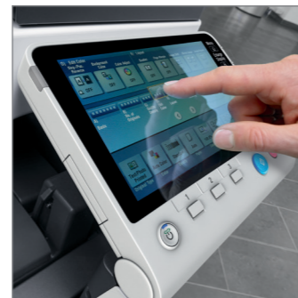
9 tum multipeksskärm med knappsett med 10 tangenter (tillval)

Den innovativa 9-tums multipeksskärmen i färg har en "knäpp, dra, zooma och rotera"-teknik som liknar funktionen i dagens smarttelefoner och datorplattor. Meny-skärmen kan anpassas så att den endast visar huvudtillämpningarna så att det blir enkelt att välja funktion för alla.