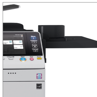
Häftning, offline (tillval)