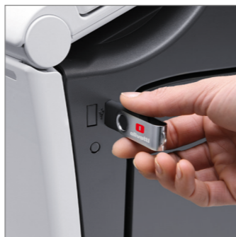
Direktutskrift och skanning via USB-minne. Direktutskrift av Microsoft Office-format (OOXML)