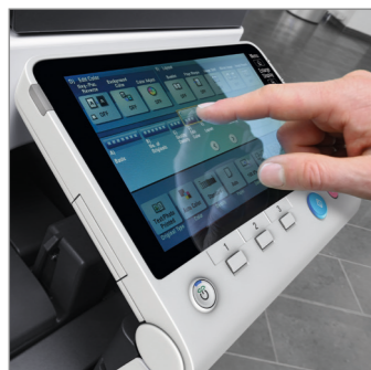
Färgkontrollpanel på 7 tum med multipekfunktioner och knappsats med 10 tangenter (tillval)